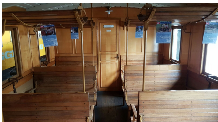
Fahrgebraum 3. Klasse